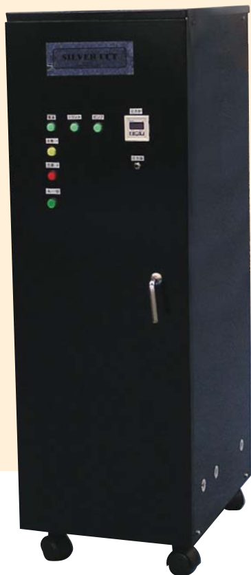
F-1型(従来型) 1分間に1ℓ中の銀泥を処理