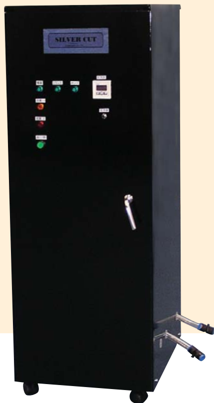
F-3型 1分間に3ℓ中の銀泥を処理